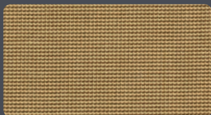
000 - Gold